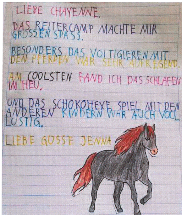
Text und Fotos: Cheyenne Kerschbaumer